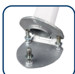
5 ПОДСТАВКА С ПЕТЛЕЙ