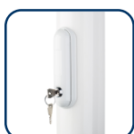
4 АНТИВАНДАЛЬНЫЙ ЗАМОК